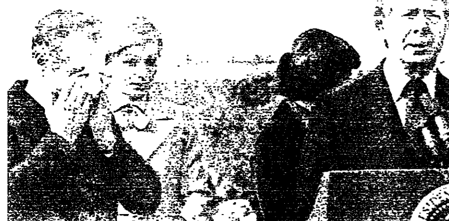
كارتر يلقى كلمة، والشاه يتفادى بحمرته الغاز، والاميرة فرح وزوجة كارتر تنظران ساعة الرجل

من جراء زيادة سعر النفط. لا استطاع ان يقول شيئاً لانه يجب ان يلتقي بما اولاً ثم اتنا ان نهج سياسة خاصة في كراكس اوروبا والاتحاد السوفياتي لشراء السلاح ان لم تكن الاسلحة الاميركية كافية ليران كي يتمكن تطبيق هذا الوقت مع خزينهم ونفقاتهم المستمرة من ان الحدود الإيرانية الساسفة مع اتحاد الجمهوريات السوفياتية هي استراتيجية حقا وعلى اقرب ان يتم بذلك. حسناً فان كتم غير محتين بنا لماذا يتوجب على ان اولي الاحتياض يتم. في برنامج التظيم المصري اثار تكديكم الزائد على النفاق ضد ايجات الكيماوية والتورية وكذلك الحروب الجنوبية استفزنا هل يستطيع الشاه ان يبدي رايه في هذا الخصوص؟ هل يصعدون ذلك القدرة الجوية؟ بالنسبة للحروب الكيماوية والجرموية نعم - من أي مصدر؟ افضل عدم نكر أي بلد بالاسم. عرض الاتحاد السوفياتي بديانه الجديدة - تي - ٧٢ - في السلحة الحمراء قبل عام. ثم قد تشتري المملكة العربية السعودية بياضات اللوبارد - الالمانية الغربية الا ان البياضات - شينين - البريطانية المصنعة لكم قبله للمقايضة مع البياضات بن النوعين المذكورين وحصل انكم بسدد الجهد عن نوع افضل. ان بياضات تشين البريطانية سوف تشكل الذروة الاساسية لترسانة الفرقة على مر الايام، وإذا تحقق ذلك فان هذه البياضات تنوق على اسنواع البنية على الصفحة ١١